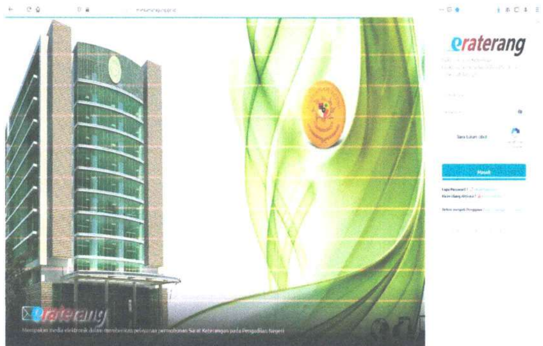
Gambar. Website/Aplikasi Elektronik Surat Keterangan