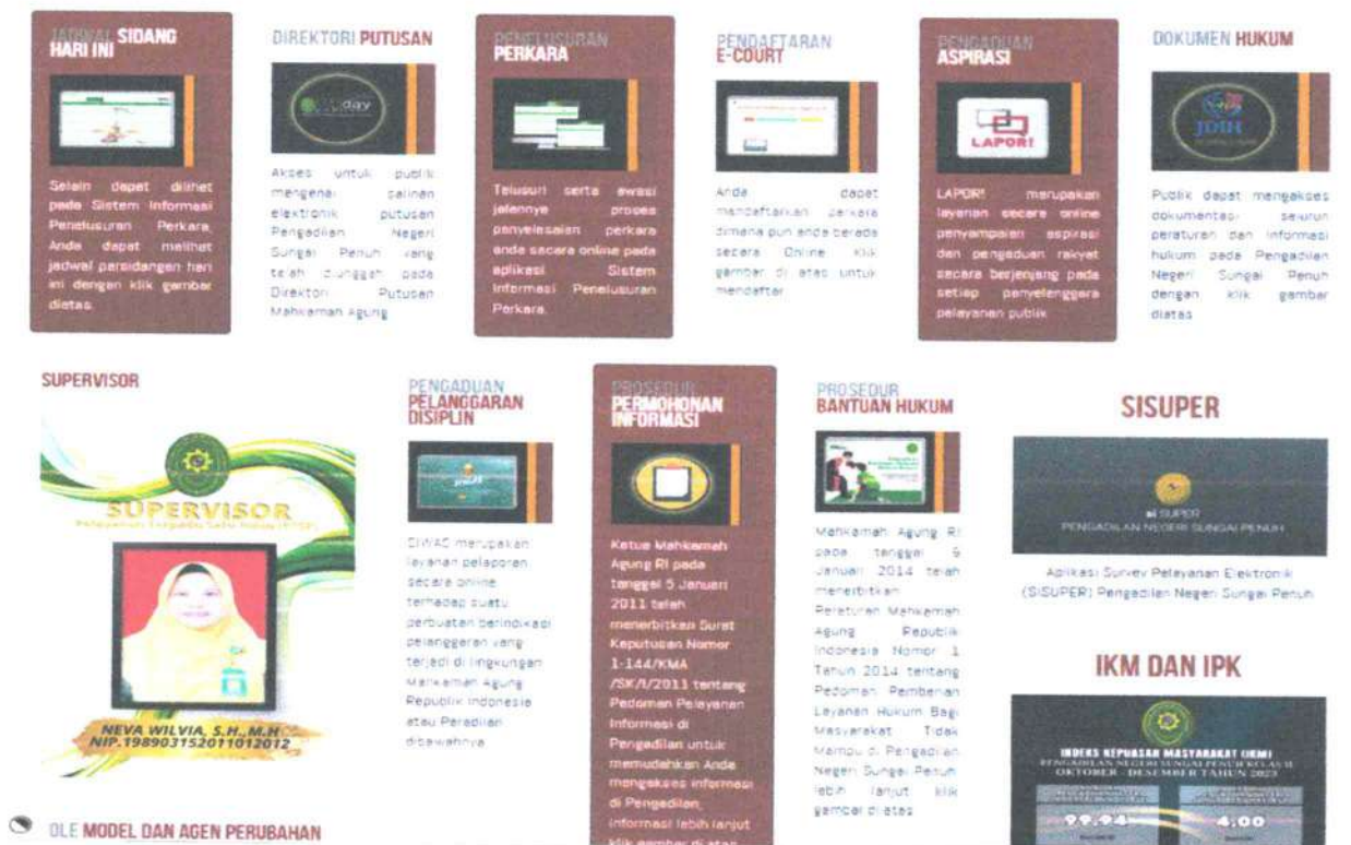
Gambar. Website Pengadilan Negeri Sungai Penuh Kelas II