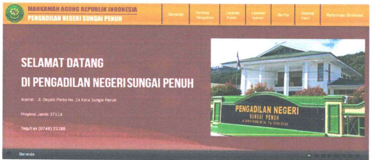
Gambar. Website Pengadilan Negeri Sungai Penuh Kelas II